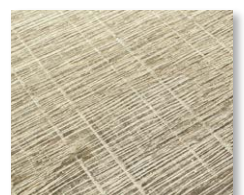
ソーカット仕上げ